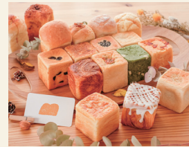
まつやまパン パン

福岡県豊前市にある焼き菓子屋。国産無農薬栽培小麦を始め九州産の菜種油やきび砂糖、平飼いの卵など身体や環境にやさしい材料を厳選し、素材を生かしたお菓子を日々焼いています。