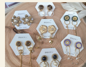
伊田ボタン ヴィンテージボタンアクセサリ

スマートフォンなどの携帯アクセサリーブランド。SPEG(スペック)は、DNA(遺伝子)と言う意味。DNAのように様々なカラーパリエーションから、あなた好みの特別なパラコードストラップを製作し、お届けします。