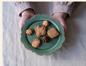
Calum 卵・乳製品不使用の焼き菓子

"からだにご褒美を"をコンセプトに体に優しい、安心・安全な材料を使用。乳製品不使用、米油を使用しています。お砂糖も白砂糖ではなく、てんさい糖を使用。ヴィーガンの方やアレルギーがある方にもおすすめです。