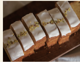
おやつのみく 焼き菓子

ヴィンテージパーツや海外パーツを使用し、大人なお洒落を幅広い年代に楽しんでいただけるアクセサリをデザインしています。天然石やシェルを使用した一点物アクセサリも多くプレゼントにもおすすめです。