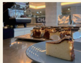
CHARCOAL BOTTLE ドリップコーヒー、焼き菓子

オムライス専門店にて20年培った技術をキッチンカーにて再現。外はカリッと、中身はトロッと仕上げたフレンチトーストはリピーターが多い逸品です◎