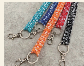
SPEG para コードアクセサリ

シルクスクリーンを活用して、帆布バックに印刷して、一点一点手作りで作っています。古着を仕入れて、販売を行っています。