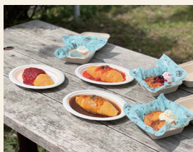
SPIDER'S kitchen オムライス・フレンチトースト

南区別府で子供食堂との日替わりで、スパイスカレー屋をやっています。今回はスパイスカレーとお子様でも食べられる牛すじカレーを持つので参戦です。外で食べるカレーは絶品です。