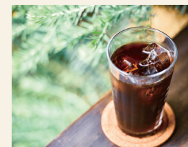
Morrow 珈琲 ドリップコーヒー・珈琲豆

祖母の代から続く手芸店で主に年代物のボタンを販売しています。年代物のボタンはデザインやお色味に味があり見ていて幸せな気持ちになれます♡ボタンを使用し心を込めてお作りしたアクセサリも販売しています。