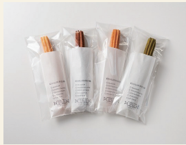
アシタノオヤツ チュロス

みやま市で活動しています♡日常からお出掛けまでお気に入りに入れてほしい!! そんな想いが叶うお店です。リアルな海を目指したレジンアートや本物のお花を使ったアクセサリをお取り扱いしております。