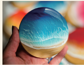
Rum HandmadeAccessory レジンアート・アクセサリ

みやま市で活動しています♡日常からお出掛けまでお気に入りに入れてほしい!! そんな想いが叶うお店です。リアルな海を目指したレジンアートや本物のお花を使ったアクセサリをお取り扱いしております。