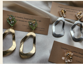
Plus ハンドメイドアクセサリ

おいしくて可愛くてアシタモ食べたい!! ちようどイ食感を目指して試作を繰り返しながらようやく完成したチュロス。"上品過ぎずラフ過ぎず" たくさんの方にこのオヤツを召し上がっていただけますように。