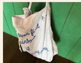
No. 古着, シルクスクリーン

ドリップコーヒーやソフトドリンク、焼き菓子などを販売します。一杯ずつ丁寧にハンドロップした、スペシャルティコーヒーをお楽しみ下さい。